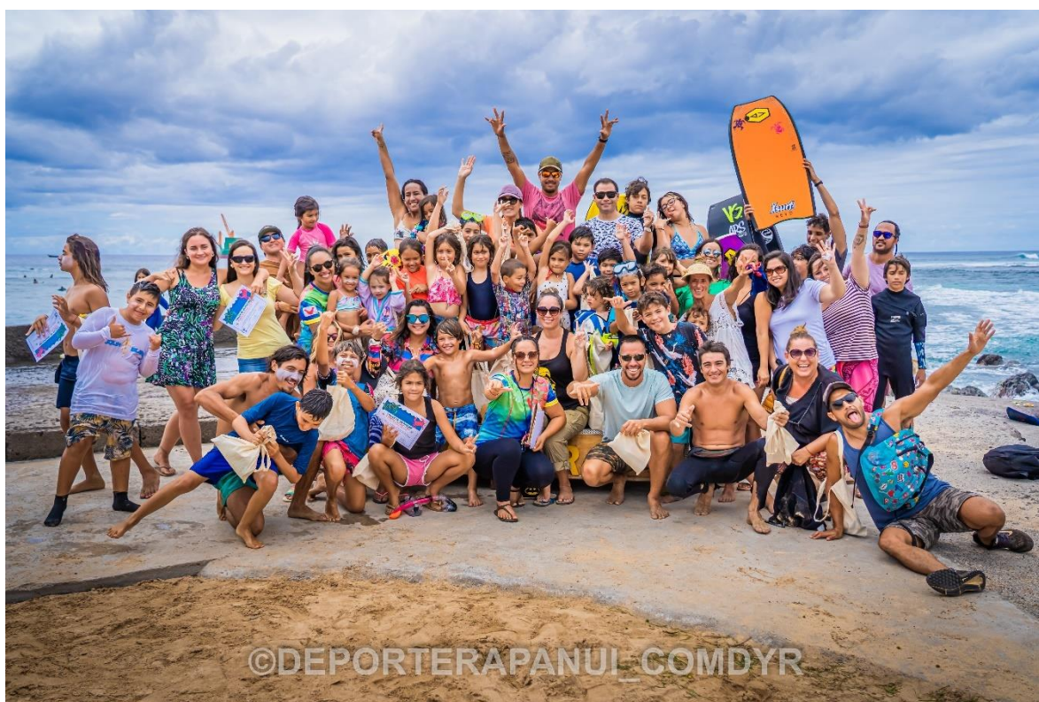
Imagen N°5: Cierre Talleres de Verano – COMDYR 2022.