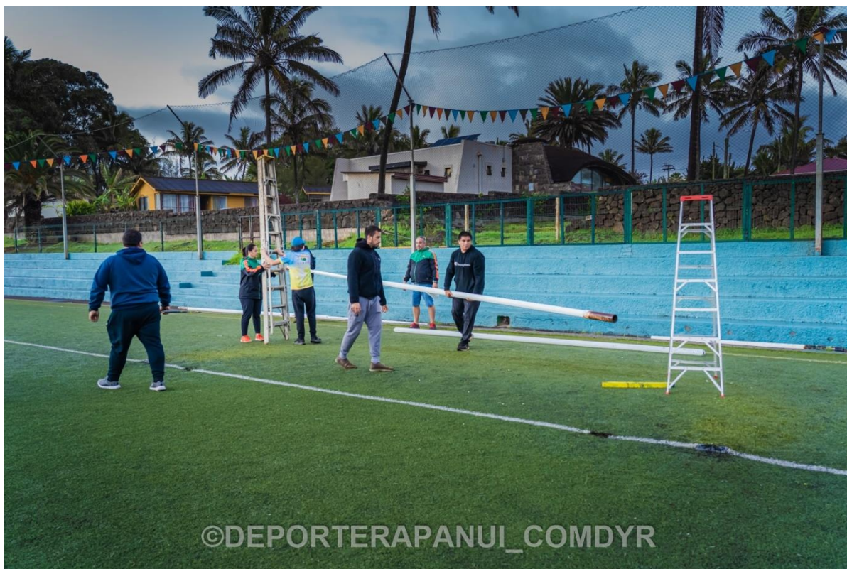
Imagen N°30: Festival de Hockey y Rugby – COMDYR 2022.