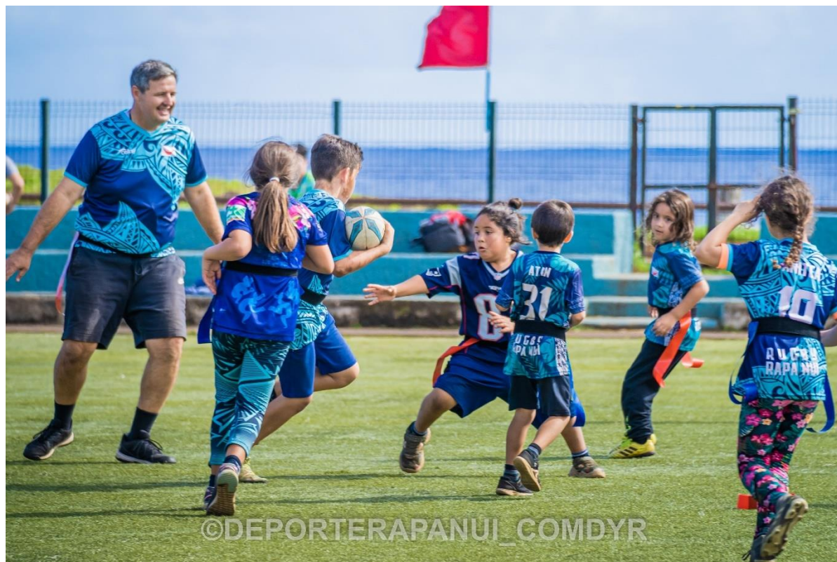
Imagen N°12: Escuela de Rugby – COMDYR 2022.