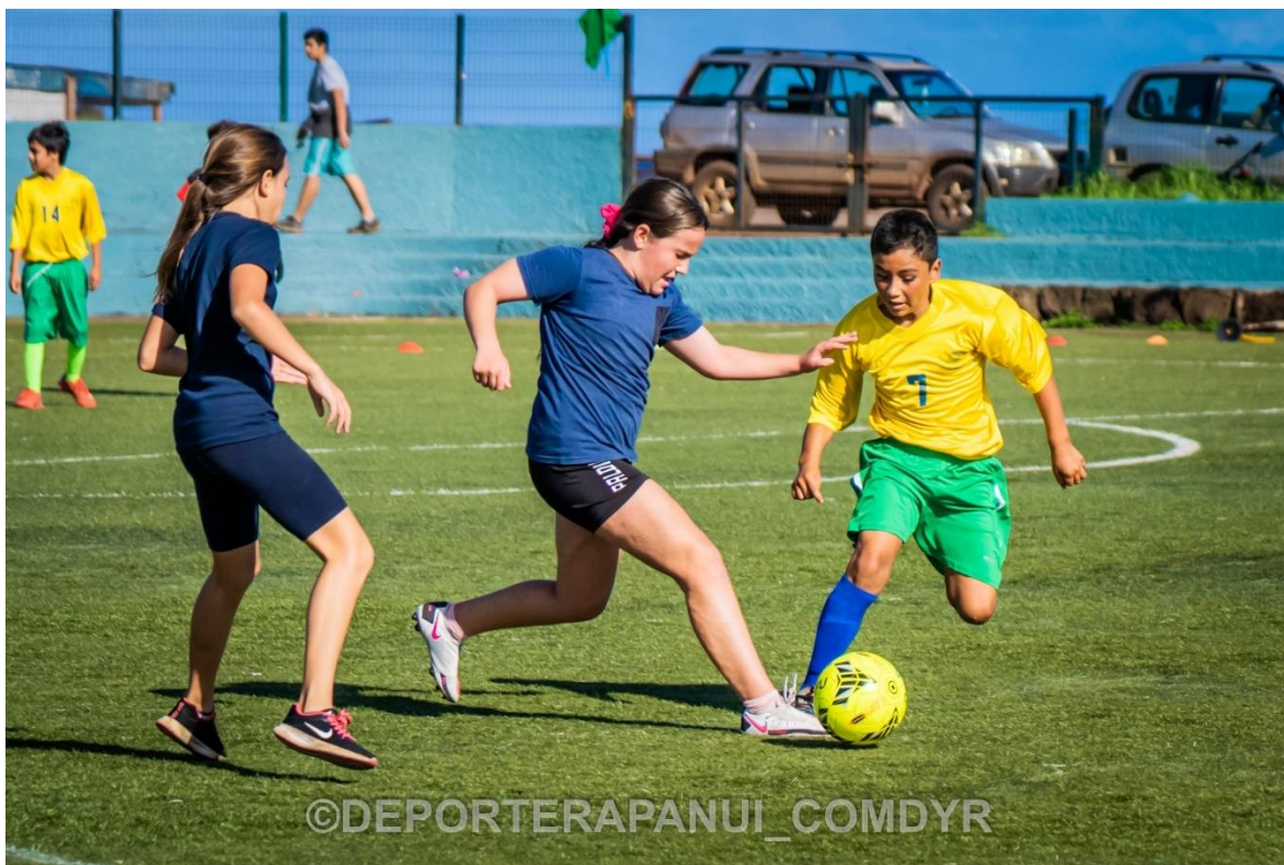
Imagen N°9: Inter Escolar Futbolito– COMDYR 2022.