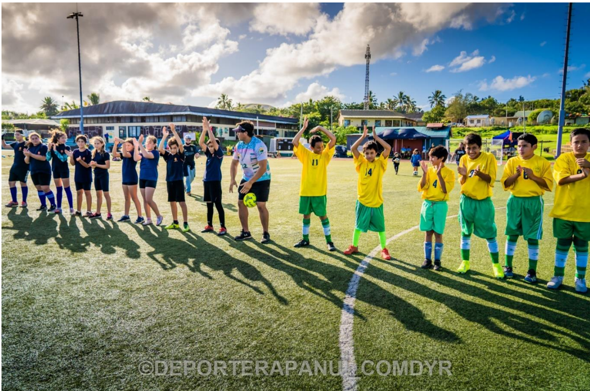
Imagen N°15: Campeonato Inter Escolar Futbolito– COMDYR 2022.