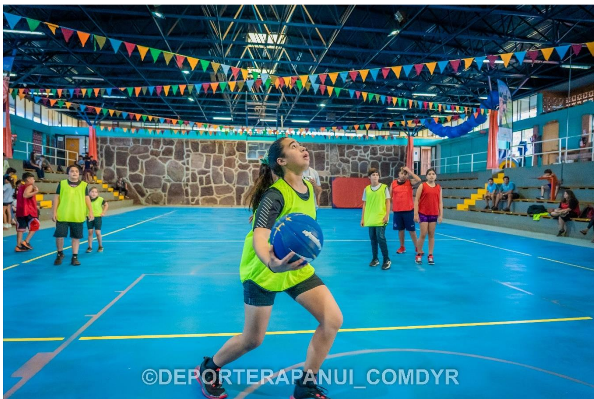
Imagen N°6: Taller de Basquetbol – COMDYR 2022.