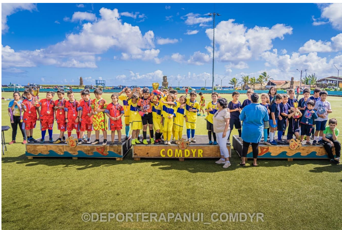
Imagen N°8: Inter Escolar Futbolito– COMDYR 2022.