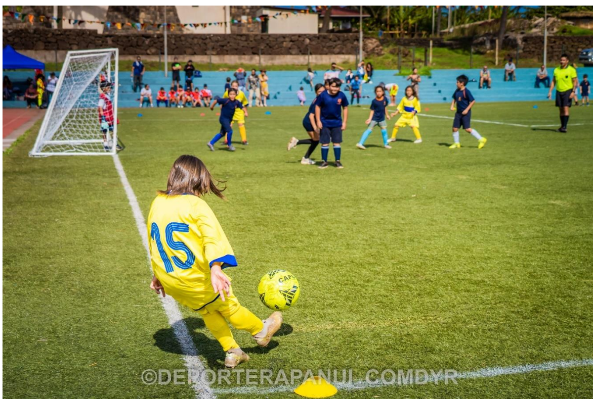
Imagen N°2: Futbolito Sub 9– COMDYR 2022.