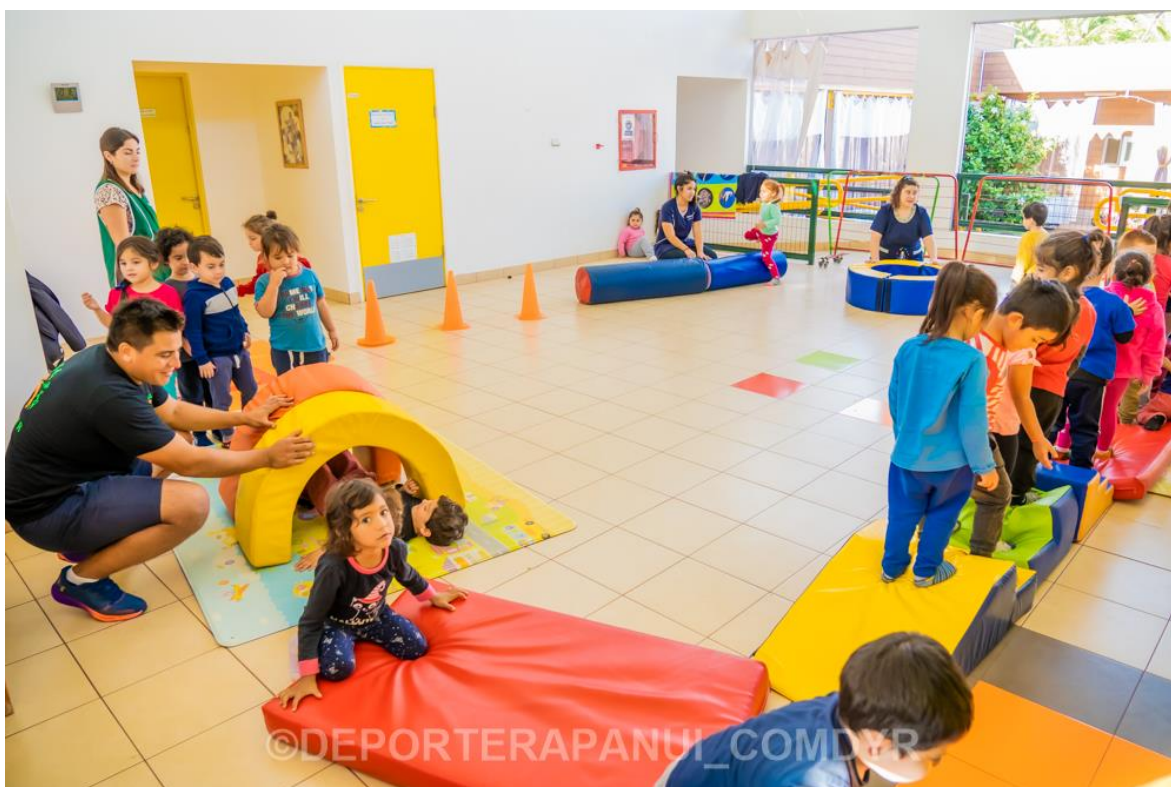
Imagen N°7: Clases Psicomotricidad Jardín Hare Ngapoki– COMDYR 2022.