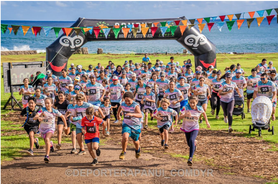
Imagen N°14: Corrida Familiar Tahuti – COMDYR 2022.