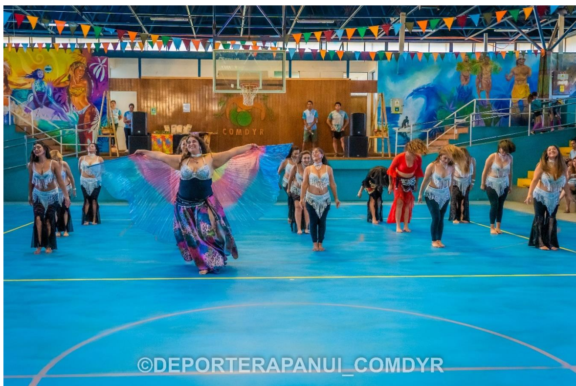
Imagen N°10: Danza Árabe– COMDYR 2022.