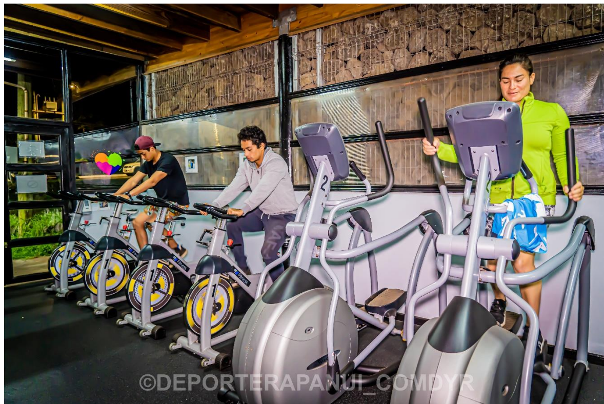
Imagen N°11: Sala de Máquinas – COMDYR 2022.