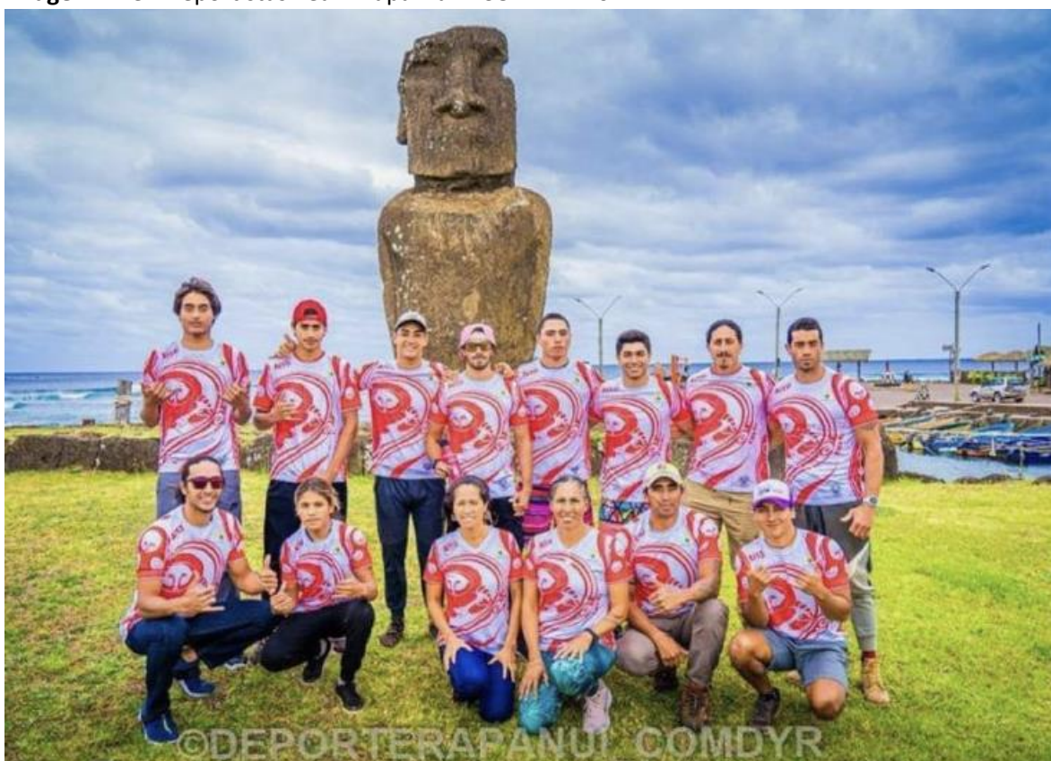
Imagen N°13: Deportistas Team Rapa Nui – COMDYR 2022.