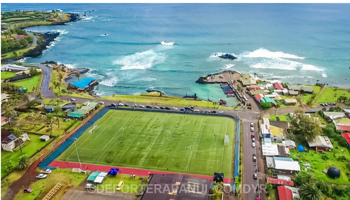
Imagen N°1: Complejo Deportivo Koro Paina Kori