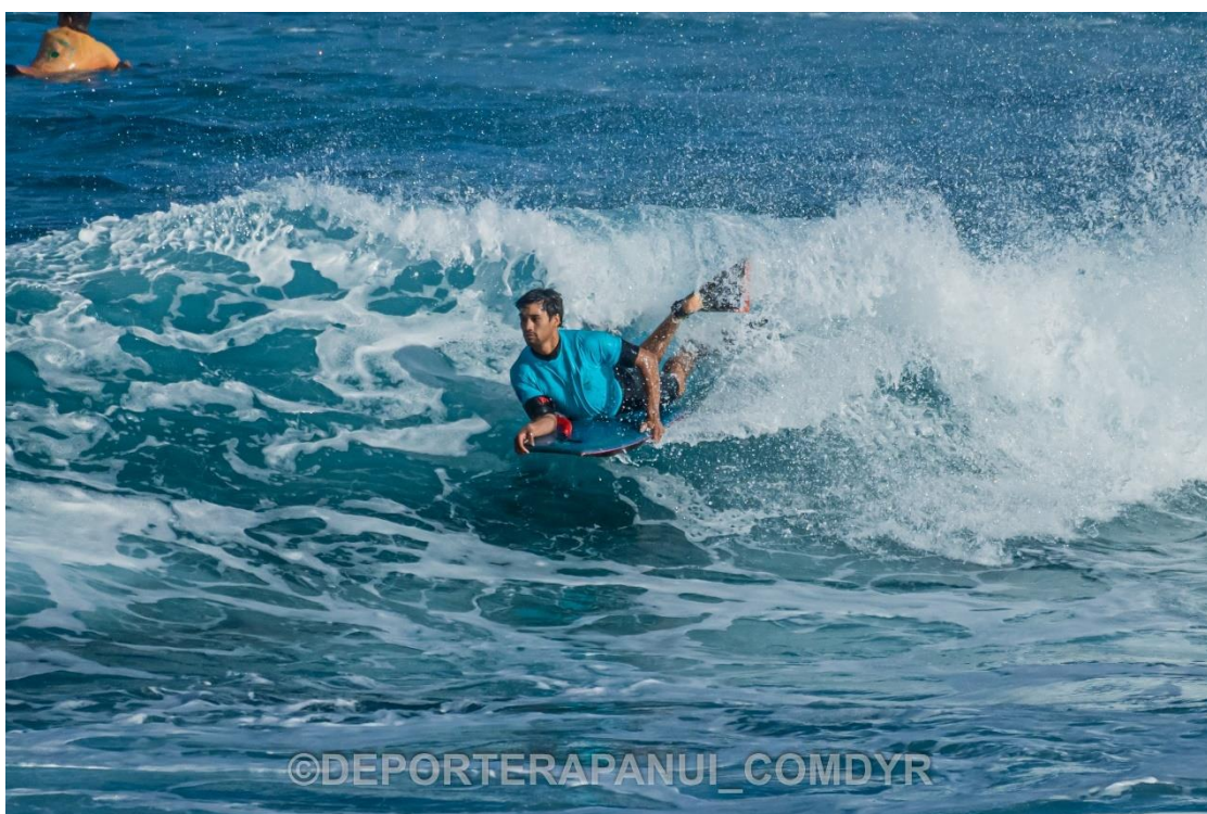
Imagen N°3: Bodyboards – COMDYR 2022.