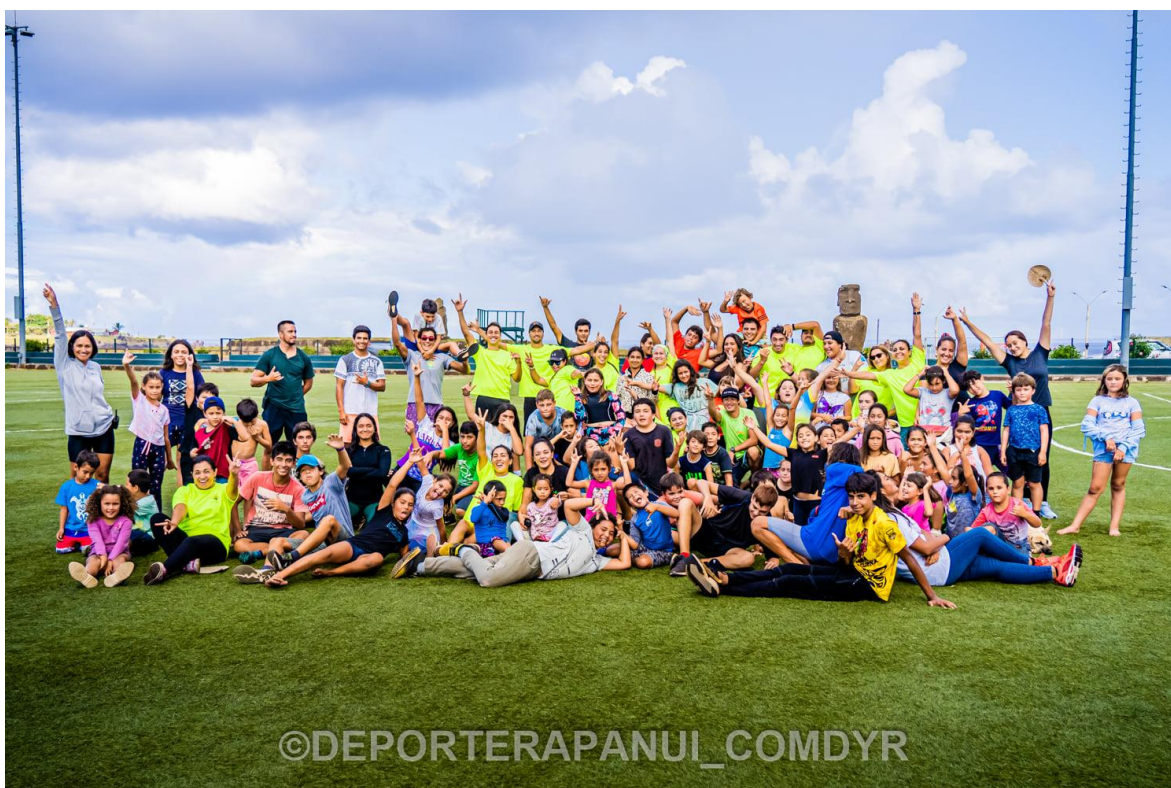
Imagen N°4: Programa de Verano Deportivo y Cultural– COMDYR 2022.