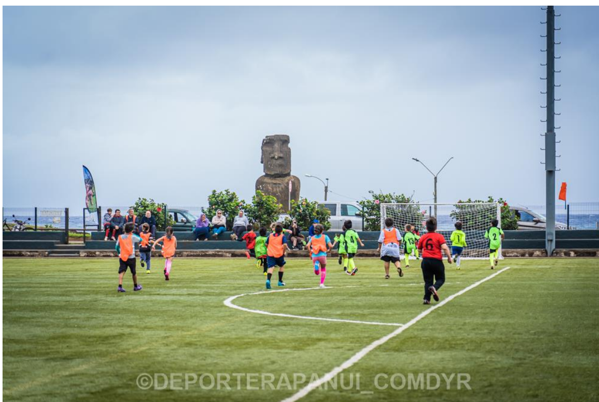
Imagen N°9: Inter Escolar Futbolito– Programa Olimpiadas Inter Escolares.