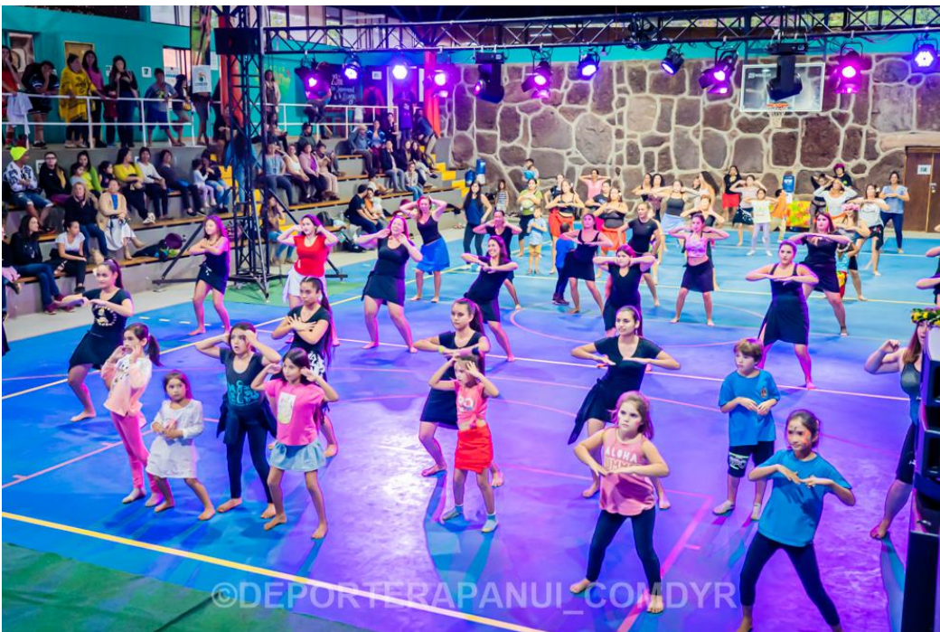
Imagen N°15: Oritón – Festival Ka Ori te Ori.