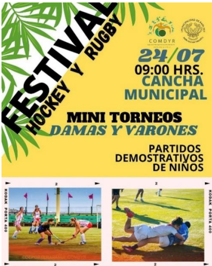
Imagen N°18: Festival de Hockey y Rugby.