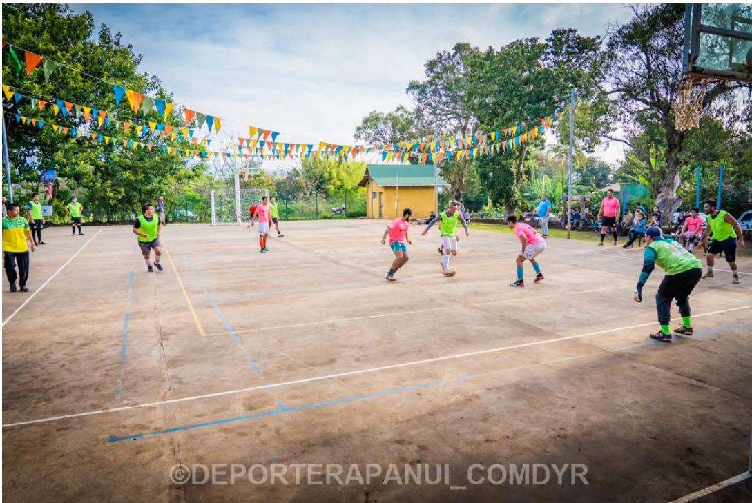
Imagen N°16: Araiki – Campeonato Barrios de Rapa Nui.