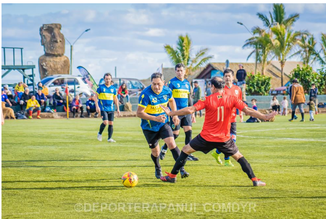
Imagen N°3: Campeonato Futbolito Super Senior – COMDYR 2021