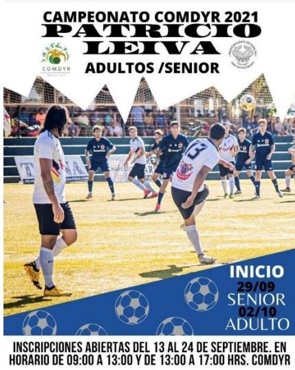
Imagen N°21: Campeonato de Fútbol Adulto – Copa Patricio Leiva.