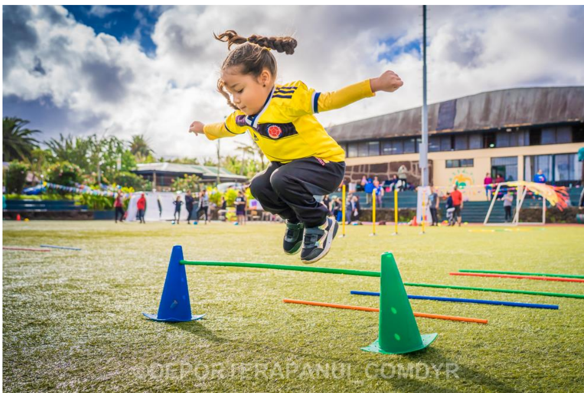
Imagen N°2: Día de la Actividad Física– COMDYR 2021