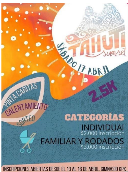
Imagen N°14: Tahuti Sunset– Corrida Familiar