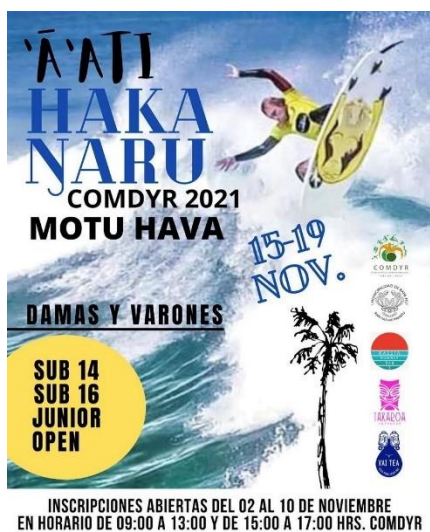
Imagen N°22: Surf Motu Hava – ‘A’ati Haka Ngaru.