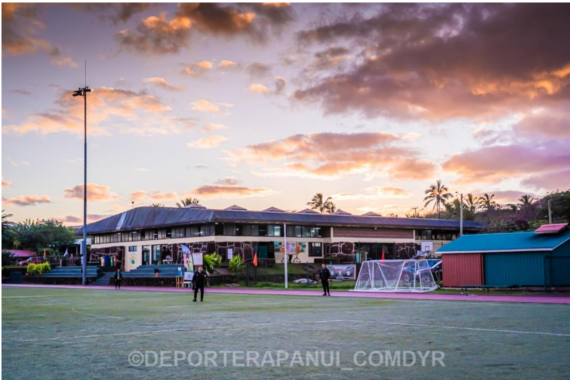
Imagen N°1: Complejo Deportivo Koro Paina Kori