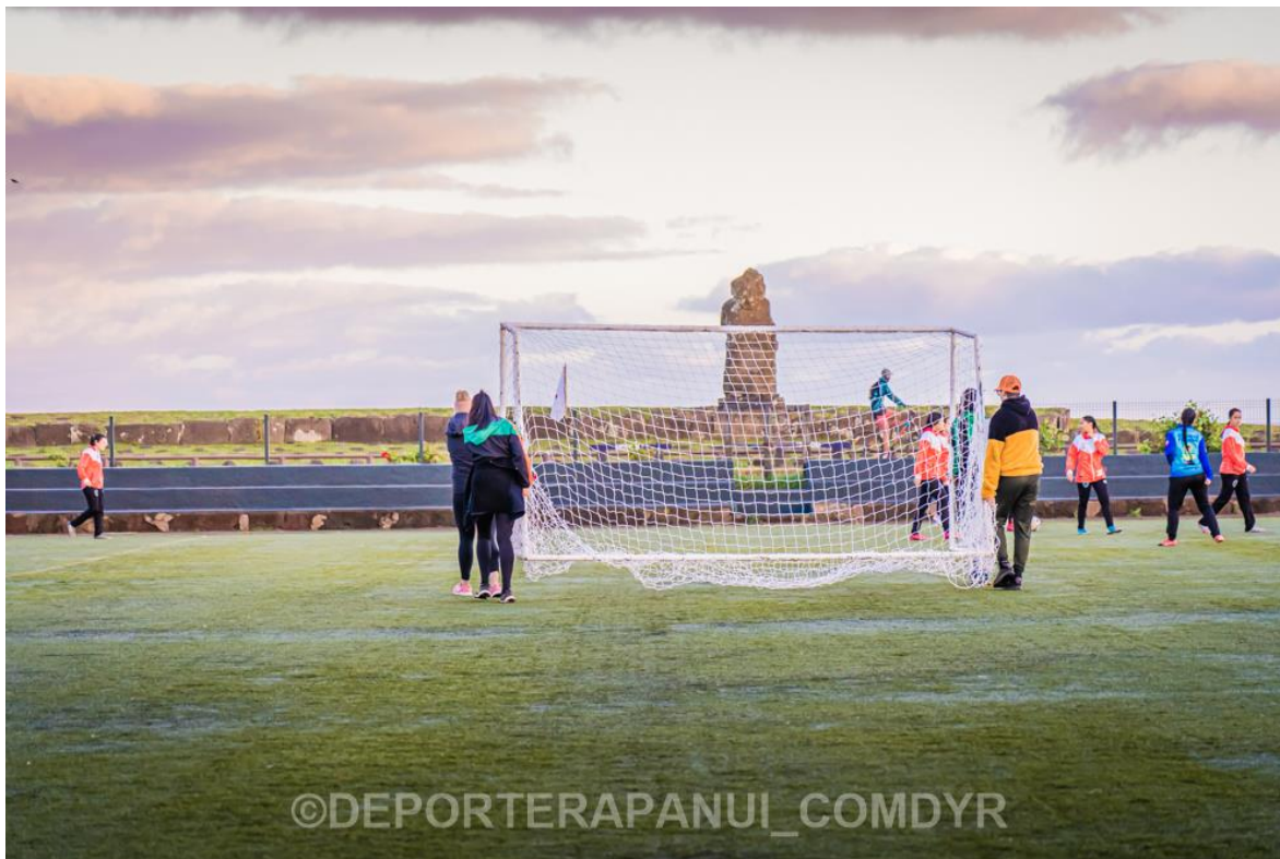
Imagen N°25: Mountain Bike – ‘A’ati Haka KĒ