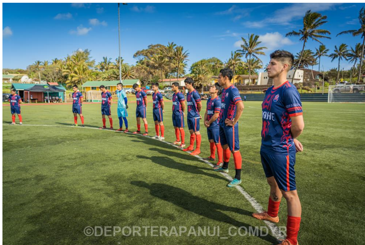
Imagen N°12: Escuela de Fútbol Diego Rivarola – Programa Koro Paina Kori