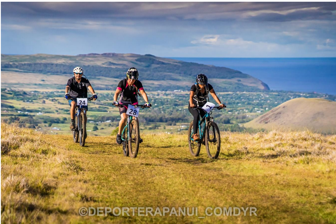
Imagen N°24: Mountain Bike – 'A'ati Haka KĒ