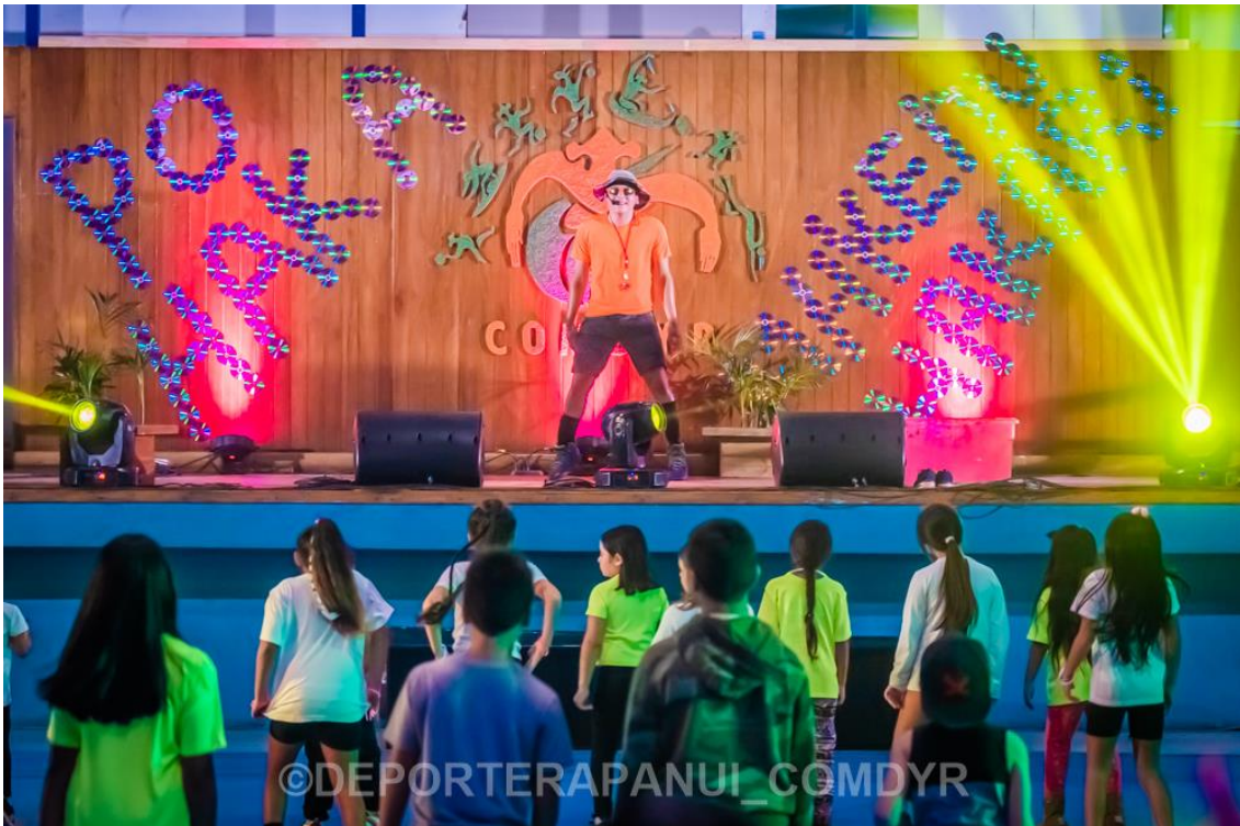
Imagen N°17: PO HAKA MAKENU HAKARI.