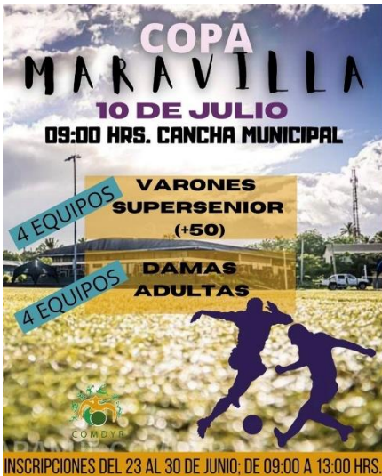
Imagen N°18: Campeonato Futbolito Super Senior y Femenino – Copa Maravilla.