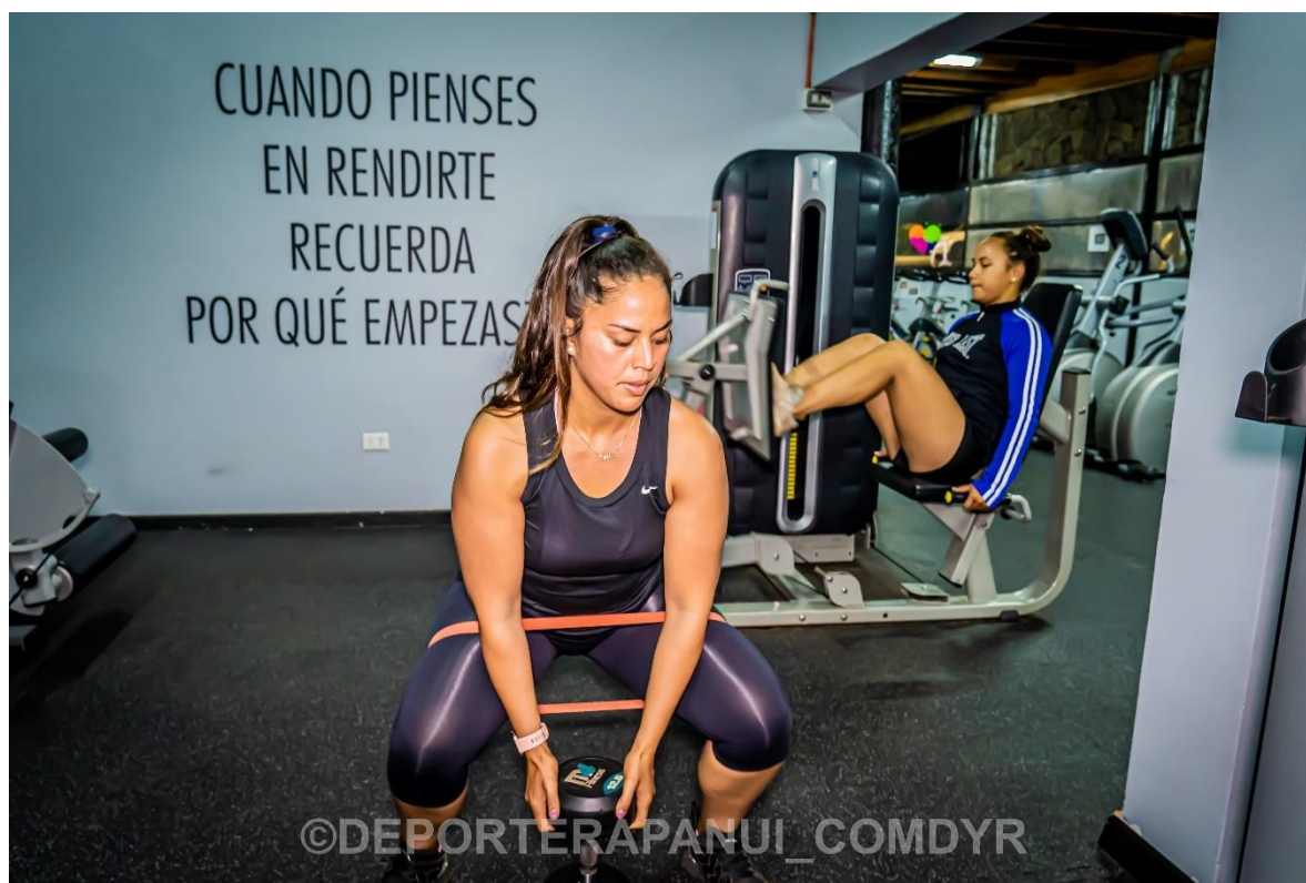
Imagen N°11: Sala de Máquinas – Programa Koro Paina Kori