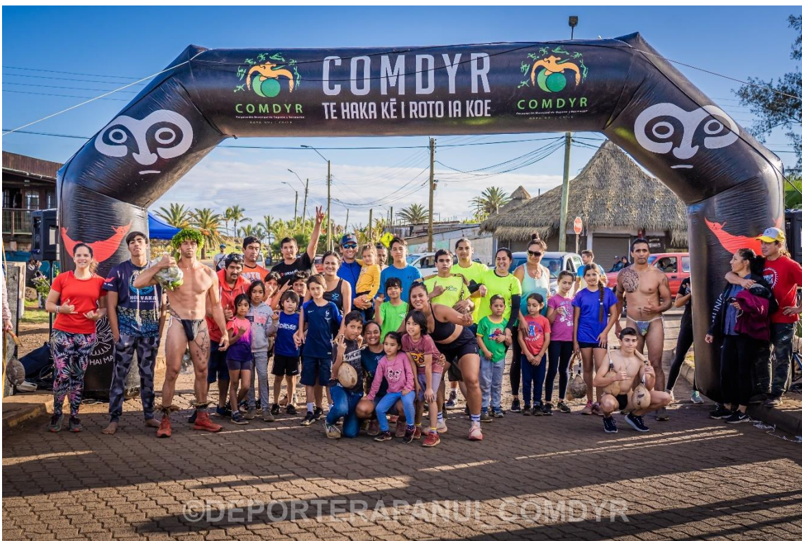
Imagen N°13: 'Akavenga Familiar – Programa 'A'ati Tupuna