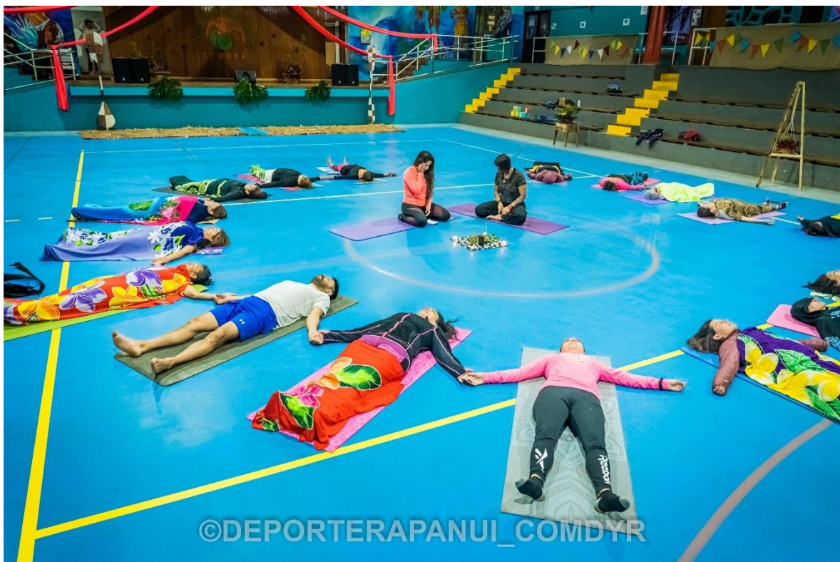
Imagen N°10: Taller Yoga– Programa Haka Makenu te Hakari.